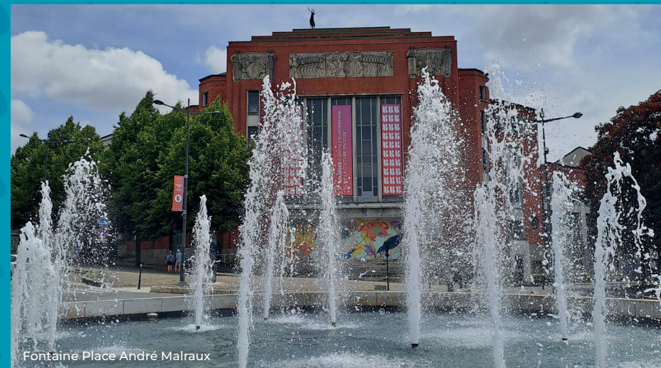
Fontaine Place André Malraux