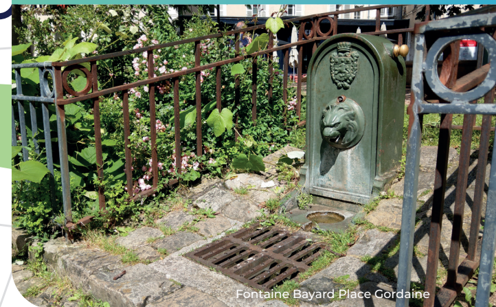
Fontaine Bayard Place Gordaine