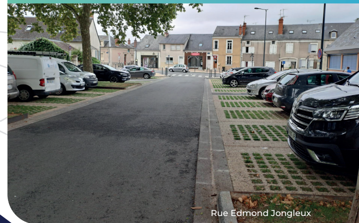
Rue Edmond Jongleux