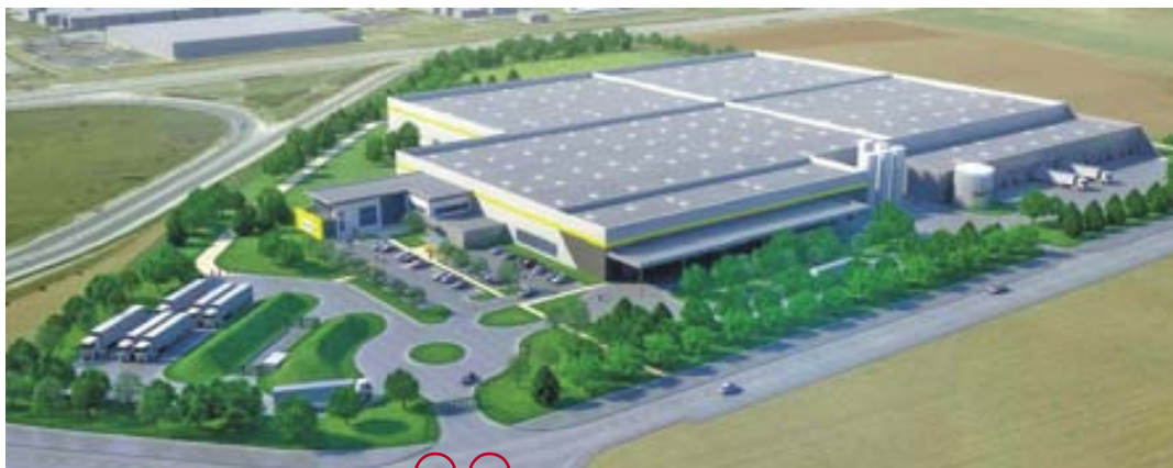
Vue 3D du futur site Recticel, sur le parc de la Voie romaine

Toujours au parc Beaulieu, côté Est, la société de courtage en assurances Gritchen Assurance y construit actuellement sur une