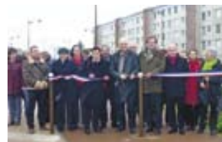
Inauguration de l'avenue de Lattre de Tassigny avec les élus

L'Agglomération Bourges Plus a eu en charge le volet circulation et sécurité routière du dossier. Dans le détail, le profil de voirie a été réduit à 6,5 m et les carrefours Mallarmé / Bertaut ont été sécurisés dans le cadre du futur axe de liaison vers le quartier Maréchal Juin. Ces modifications notables devraient permettre une plus grande fluidité de circulation, le trafic actuel sur l'avenue étant de l'ordre de 5 100 véhicules par jour. Les conditions de stationnement ont été corrigées pour un stationnement longitudinal bilatéral, dans le respect de la circulation des piétons et des cyclistes.