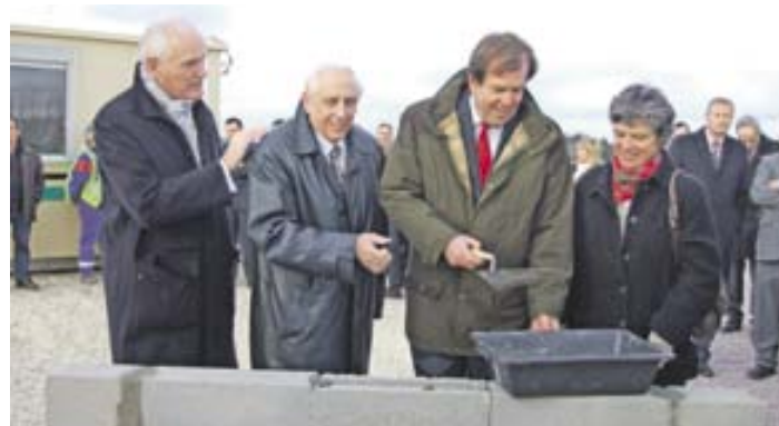
Pose de la première pierre du futur bâtiment Rosinox

Le parc de la Voie romaine bénéficie, comme l'ensemble des parcs d'activités, des aménagements nécessaires à l'implantation des entreprises. Bourges Plus gère l'ensemble de ces travaux d'aménagements .