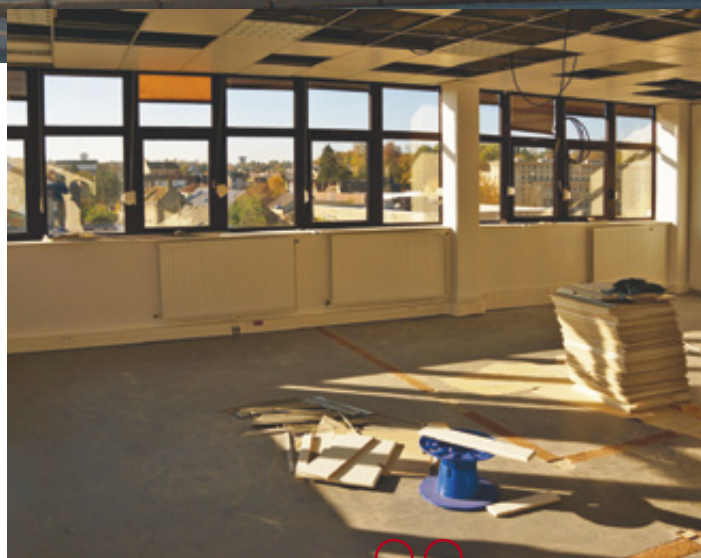
Les travaux se terminent