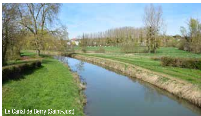
Le Canal de Berry (Saint-Just)

En 2015, 935 000 cyclistes dont 43% touristes, ont parcouru la Loire à Vélo et ont généré 29,6 millions d'euros de retombées économiques. L'agglomération, forte de sa nouvelle compétence touristique, compte bien accompagner cette opportunité, et participe à son financement.