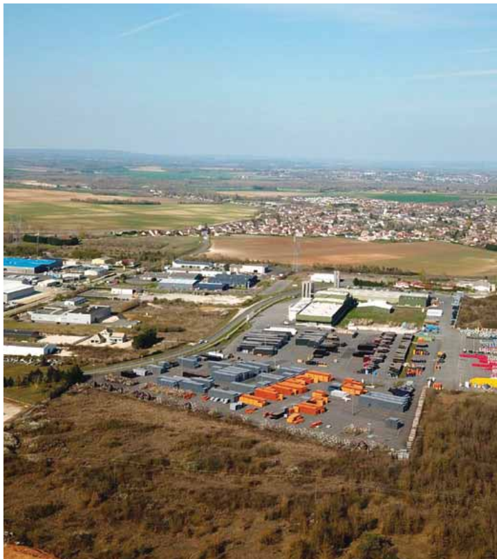
Situé sur la commune de La Chapelle Saint-Ursin, le parc ORCHIDEE (ORganisation CHapelloise pour l'Installation et le DEveloppement des Entreprises) accueille des entreprises industrielles et artisanales.