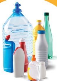
BOUTELLES ET FLACONS PLASTIQUES

ATTENTION : CHANGEMENT DES CONSIGNES DE TRI AU 1 ER JANVIER 2023