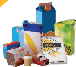
CARTONNETTES ET BRIQUES ALIMENTAIRES

ATTENTION : CHANGEMENT DES CONSIGNES DE TRI AU 1 ER JANVIER 2023