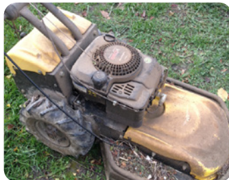
Tondeuse-débroussaillieuse capable de broyer des branches fines