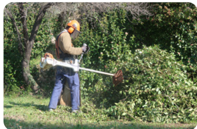
Broyage au débroussaillieur à lames de branches mises en tas et résultat obtenu