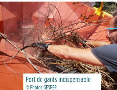
Port de gants indispensable

Toujours prendre connaissance des consignes d'emploi et de sécurité propre au broyeur avant usage.