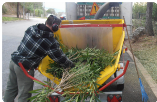
Broyage et paillage direct

D'un point de vue environnemental, le broyage sur site est le plus pertinent (principe d'utilisation sur place) et permet le paillage direct. >> FICHE 1