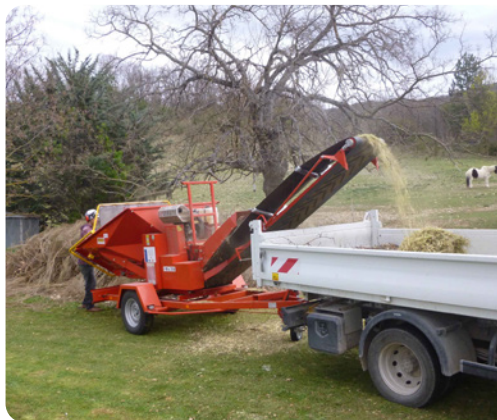
Chargement sur camion ou remorque

en vue de paillage hors site