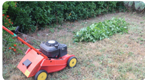
Broyage à la tondeuse d'un petit tas de déchets verts étalé