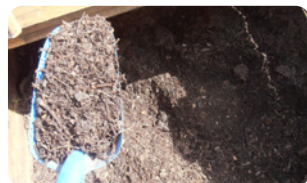
Broyat plus ou moins ligneux et/ou fin suivant les entrants et le broyeur