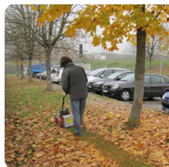
Broyage de feuilles à la tondeuse