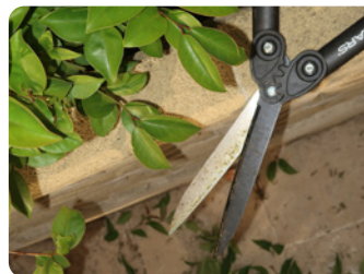
Découpe fine à la cisaille