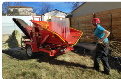
Mise à disposition à des particuliers d'un broyeur professionnel

Location de broyeur (tarif commercial) : environ 150-200 €HT/jour.