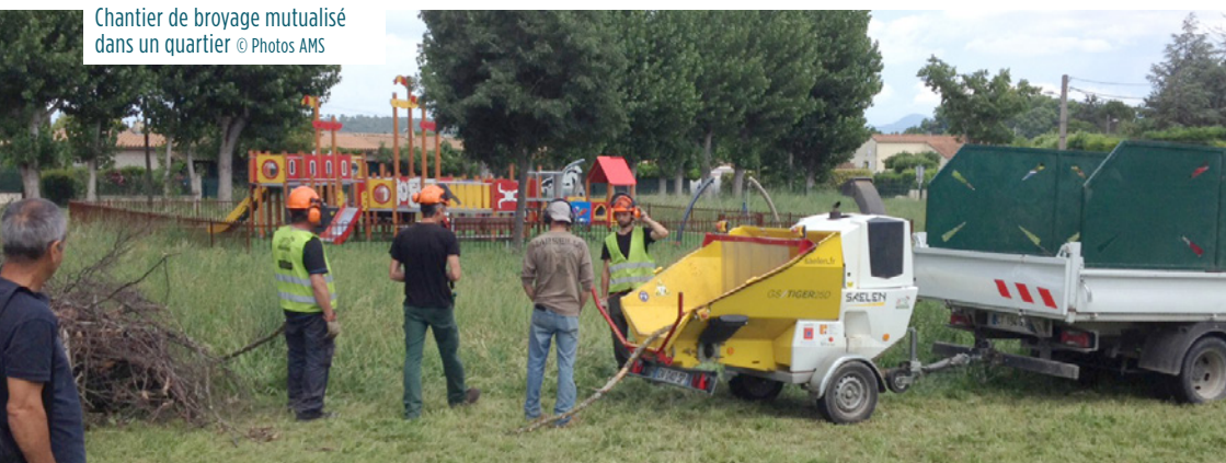
Chantier de broyage mutualisé dans un quartier