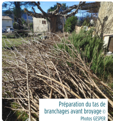
Préparation du tas de branchages avant broyage

Avant de broyer, regroupez et alignez les branches en tas.